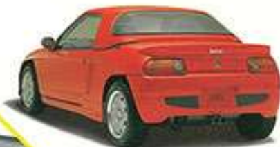
REAR AERO BUMPER KIT ¥56,000 8410-XG4-K050-R, Y, S, W 流体力学を考えた形状に、エアリフト効果のエアリフト。流体力学効果は高いです。共通カーブの付いた高剛性の樹脂製。エアリフト効果です。ハードトップと併用が可能です。