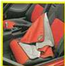
BLANKET ¥10,000 90000-Y27-0014-R, Y, S, W 赤と黒の配色のブランケット。取り付け簡単。車中での防寒対策が有効です。