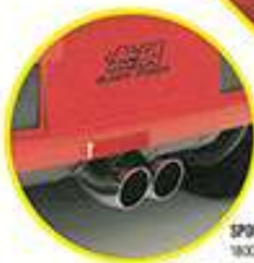
SPORTS EXHAUST SYSTEM ¥49,000 18000-XG4-K050

本車専用設計のスポーツエキゾーストシステム。付属のステンレスパイプは、一般公道でも安心して使用できる。排気量に合わせた排気量はVVA（可変バルブタイミング）システムにて、JAFMA自動車検査局の型式検査に合格しています。