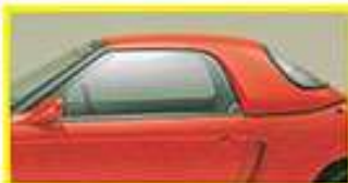
HARD TOP KIT ¥246,000 80000-XG4-K050-R, Y, S, W ハードトップと窓ガラスの一体化した、真鍮製の専用部品を装着。ガラスは強化ガラス製。車中での防犯対策の目安として、盗難防止対策が有効です。