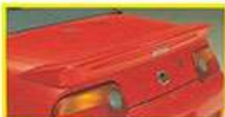
AIR SPOILER ¥25,000 8410-XG4-K050-R, Y, S, W 流体力学を考えた形状に、エアリフト効果のエアリフト。流体力学効果は高いです。共通カーブの付いた高剛性の樹脂製。エアリフト効果です。ハードトップと併用が可能です。