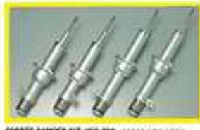
SPORTS DAMPER KIT ¥58,000 50000-XG4-K050

本車専用設計のスポーツエキゾーストシステム。付属のステンレスパイプは、一般公道でも安心して使用できる。排気量に合わせた排気量はVVA（可変バルブタイミング）システムにて、JAFMA自動車検査局の型式検査に合格しています。