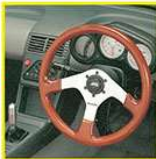
STEERING WHEEL ¥34,000 5210-086-K050